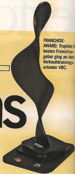
FRANCHISE-AWARD. Trophäe für besten Franchisegeber ging an den Verkaufstrainingsanbieter VBC.

Die Prämierung der besten Franchisemodelle sowie eine aktuelle Studie rücken die volkswirtschaftliche Bedeutung des „Unternehmertums mit System“ in den Vordergrund.